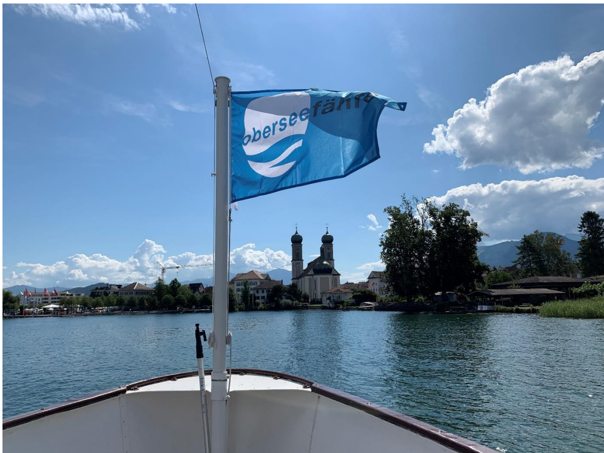
Oberseefähre vor Lachen